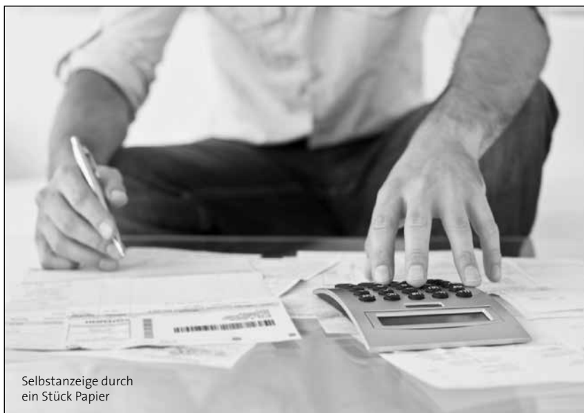
Selbstanzeige durch ein Stück Papier

Allerdings gibt es für den „Anzeiger“ seit 2010 eine wesentliche Erleichterung: Wenn der Täter die Umsatzsteuer im laufenden Jahr wissentlich nicht bezahlt hat oder zumindest bedingt vorsätzlich keine UVAs eingereicht hat, aber anschließend die korrekte Umsatzsteuerjahreserklärung unterschreibt, gilt er als „Anzeiger“. Für ihn erübrigt sich eine gesonderte Täternennung, die oft vergessen wurde. ●