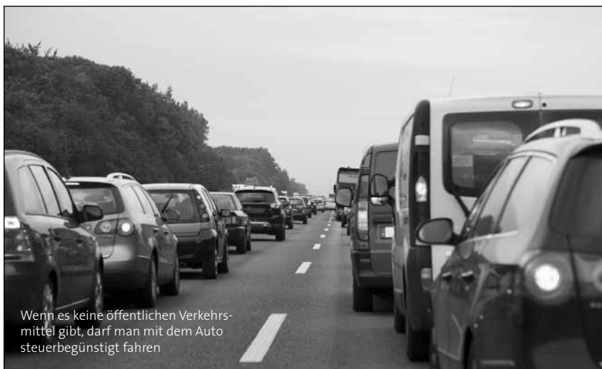
Wenn es keine öffentlichen Verkehrsmittel gibt, darf man mit dem Auto steuerbegünstigt fahren